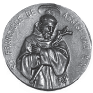
Hl. Franz von Assisi

Die Barmherzigkeit im Sinnbild des Mantels des Kleides: Martin von Tours, Franz von Assisi, Elisabeth von Thüringen und der Ordensfrau Mutter Teresa