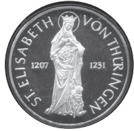
Hl. Elisabeth von Thüringen

Der Mantel - Ein Mantel ist ein schönes Sinnbild, er wärmt und schützt. Der Mantel der Heiligen steht für den göttlichen Schutz, der den Menschen umhüllt. Und diesen geben sie weiter, sie teilen ihn mit den Armen.