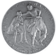
Hl. Martin von Tours